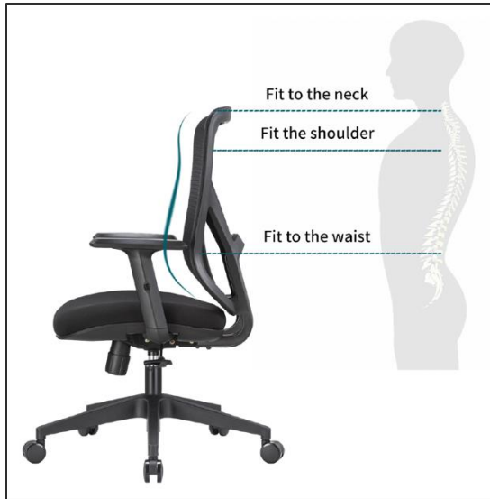
La curvatura ergonómica de su respaldo permite que soporte el cuello, los hombros y la cintura de manera eficiente