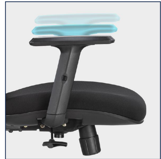
Apoyabrazos ajustable en altura que se adaptan a distintas dimensiones de cuerpos