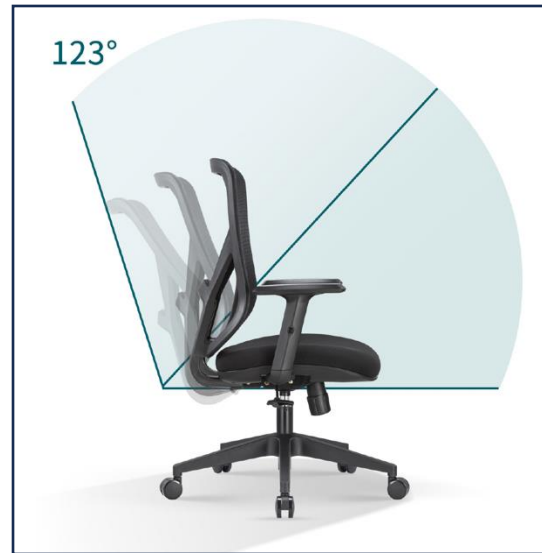
Reclinación en 123º con posición de bloqueo en posición original y mecanismo sincrónico